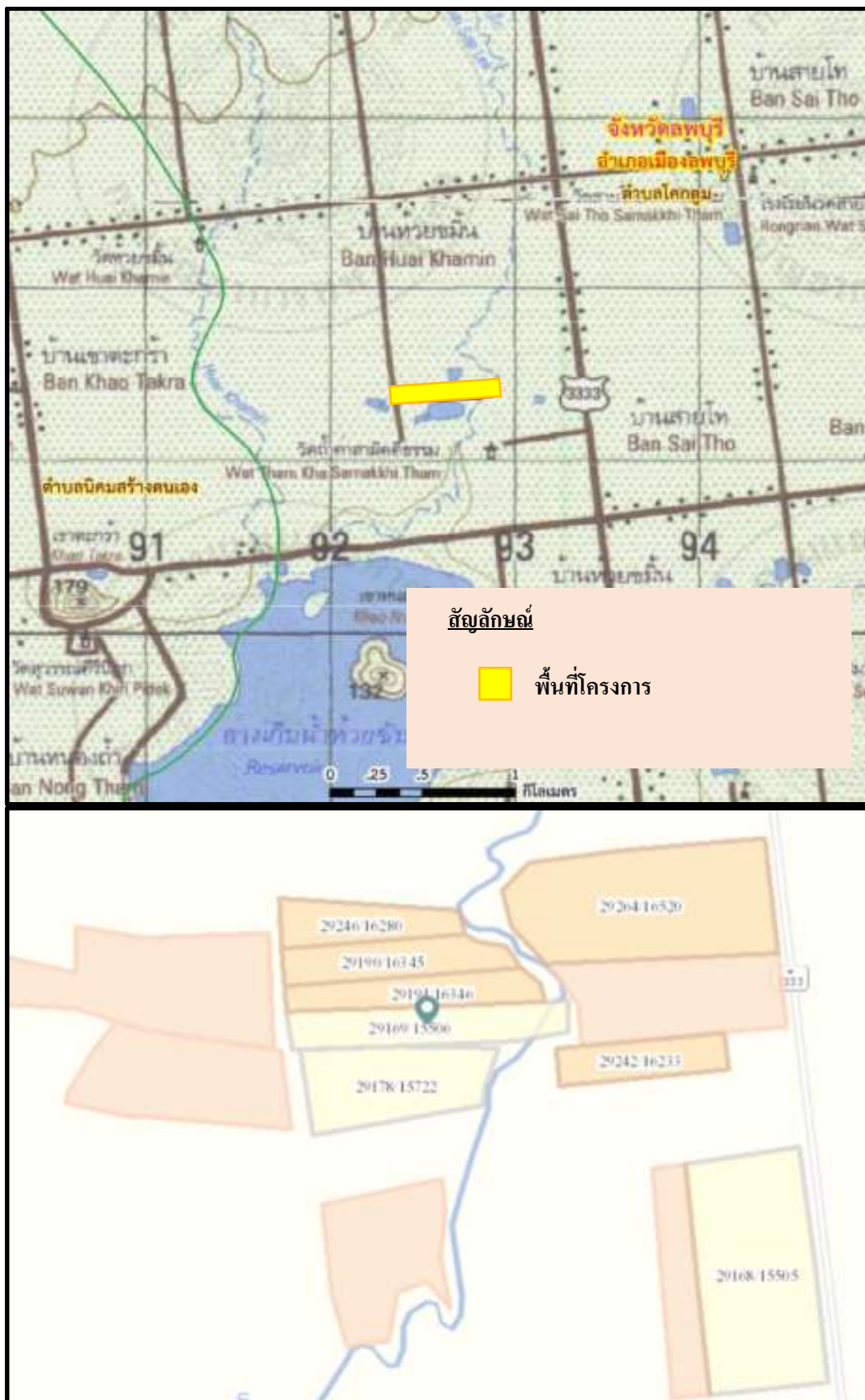
รูปที่ 1-1 แผนที่แสดงที่ตั้งของโครงการ